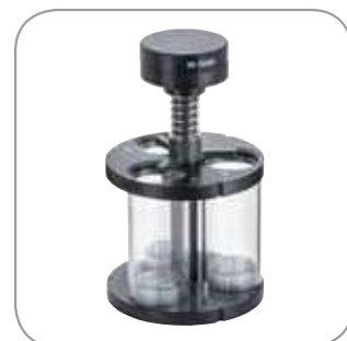
Panier de contrôle spécial pour comprimés de grande taille