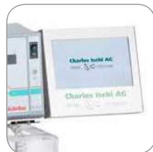
Le DISI-A Touch se pilote par le biais de l'écran tactile